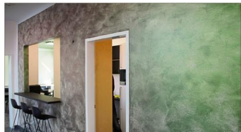
Ganz neu in der Malerbranche: Anstriche, die je nach Ansicht die Farbe ändern.

naus bekannt. Selbst die Motivation der Mitarbeiter ist seit dem Umzug gewachsen. Mir kommt also nur Po-