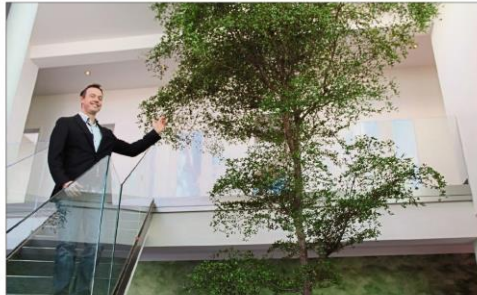
Das Zentrum des neuen Bürogebäudes, der kalifornische Indoor-Baum.