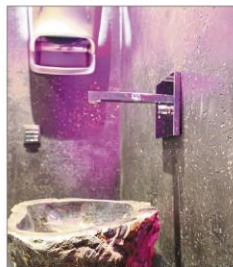
Sogar die Sanitäranlagen bestechen durch futuristisches Design.